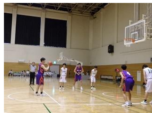
バスケットボール男子