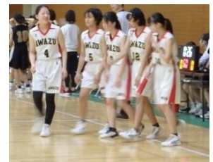
バスケットボール女子