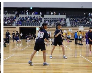
バドミントン女子